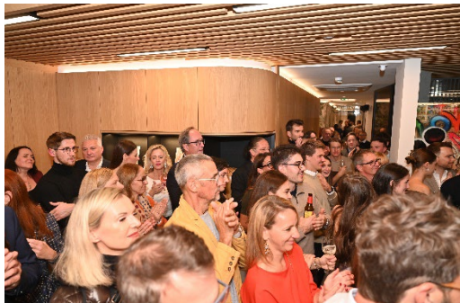
11 Zahlreiche Gäste feierten die Eröffnung der Zahnklinik