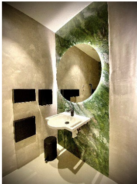
6 Waschraum © Heydents