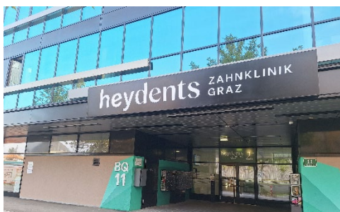
2 Außenansicht