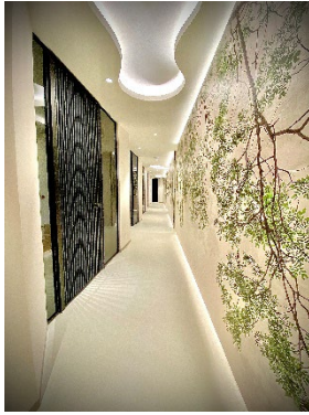
5 Gang © Heydents