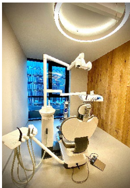
8 Behandlungsstuhl

heydents Zahnärzte Brauquartier 11, Top 11 8055 Graz