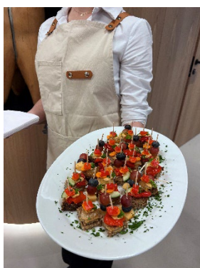
10 Kulinarik