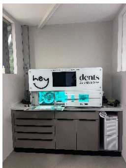
9 Neueste technische Standards in der heydents Zahnklinik