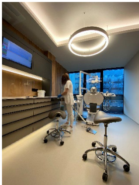
7 Behandlungsraum